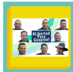
DEFENSORS DE L'AIGUA DEL GUAPINOL

Fes click aquí per veure el vídeo de la campanya.